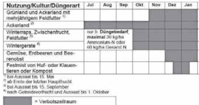
Abbildung 1: Sperrfristen n. neuer Düngeverordnung für Düngemittel mit wesentlichem N-Gehalt

auf Ackerland bis zum 31. Januar des Folgejahres.