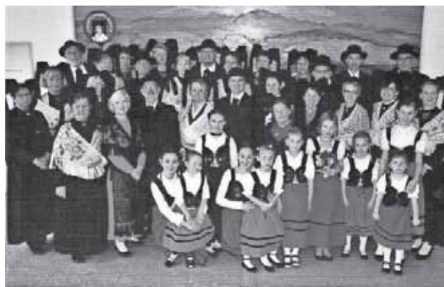
30 Jahre Trachtengruppe 2017