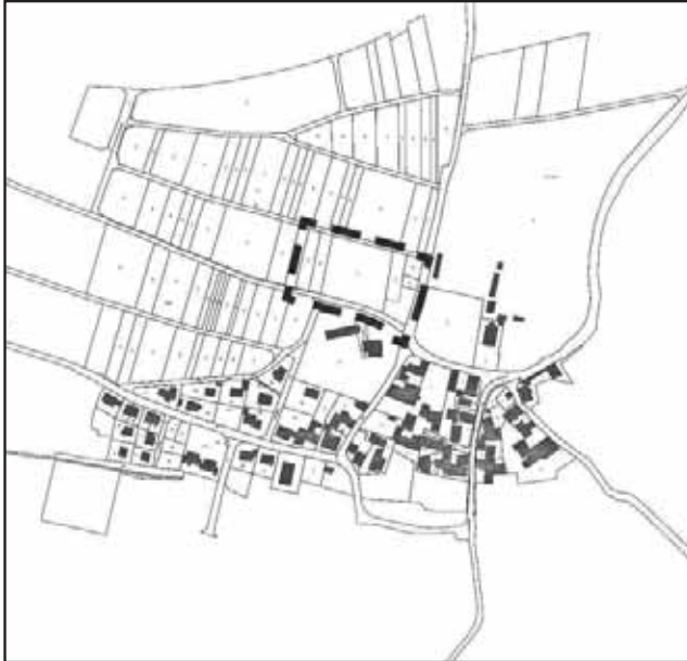
Gemarkung Laufen: Bereich „Bürgerzentrum“

Umwandlung einer Fläche für die Landwirtschaft in eine Fläche für Gemeinbedarf mit der Zweckbestimmung „Bürgerzentrum“.